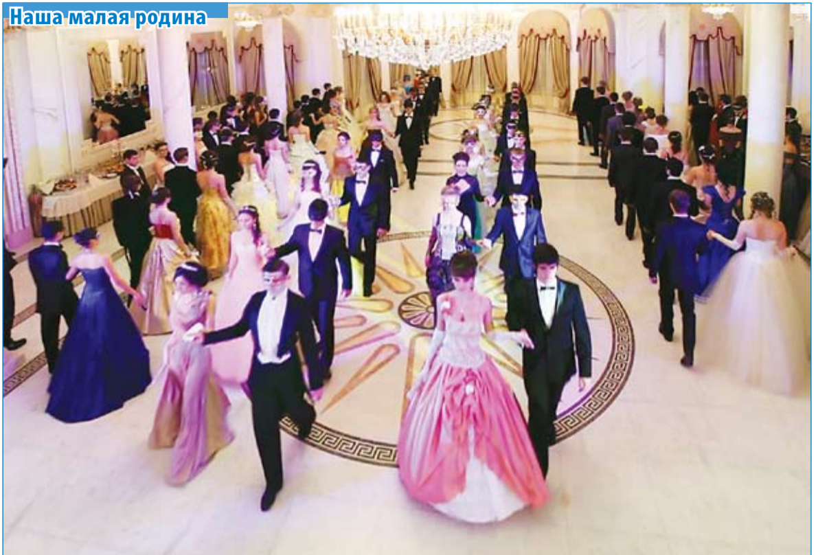
Лучшие учащиеся Ессентуков на рождественском балу. Читайте стр. 7.

19 января , в субботу, с 12.00 до 13.30 в районе центрального городского озера г. Ессентуки состоится народное гуляние, посвященное празднованию Крещения Господнего. В программе мероприятия: