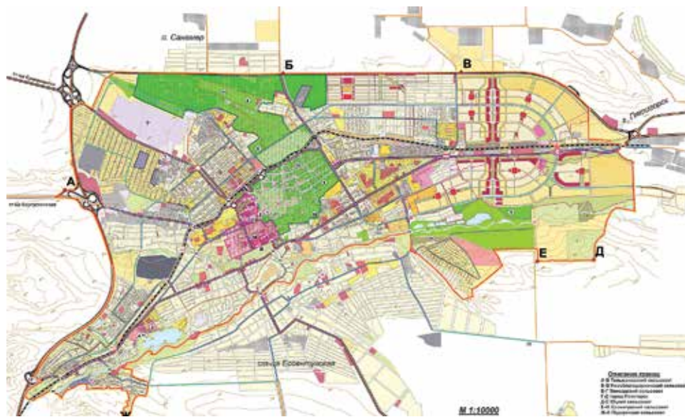
Карта Генерального плана муниципального образования города-курорта Ессентуки, основной чертеж