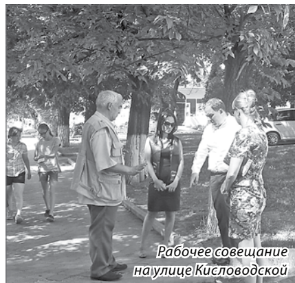
Рабочее совещание на улице Кисловодской

ваться на волейбольной площадке городского озера.