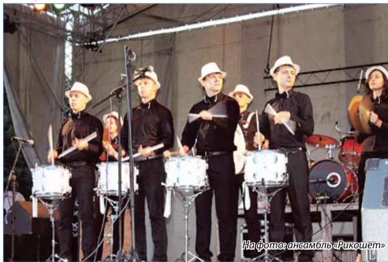
На фото: ансамбль «Рикошет»

точно известный в Нальчике барабанщик, сел за установку только в 20 лет. Размеренный ритм его инструментов взбудоражил слушателей и заставил откликнуться музыке в такт.