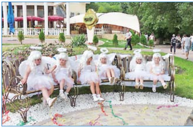
Ангелочки приглашают влюбленных загадать желание...

Не хотелось бы в этот добрый праздник приводить печальную статистику, но институт брака в наше время находится в глубоком кризисе. На 1000 браков в России приходится 800 разводов. Наша страна одна из самых неблагополучных в этом вопросе. Но бесспорно, каждый вступающий в брак, мечтает создать крепкую,