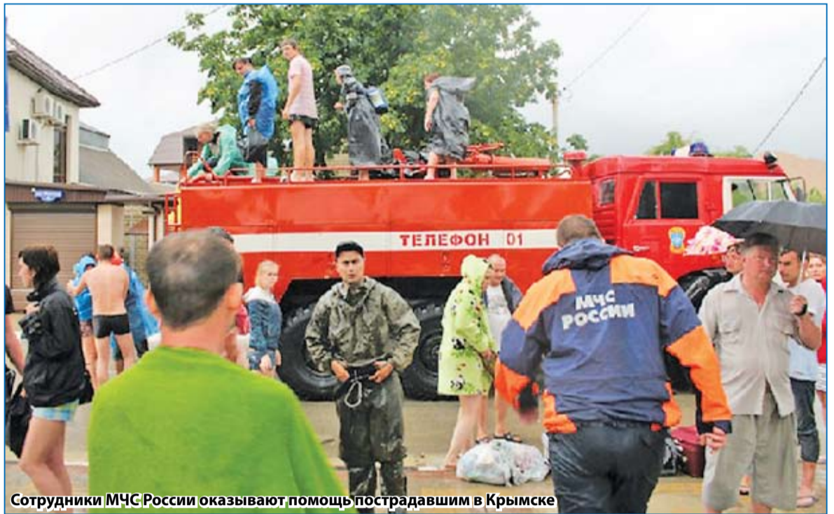
Сотрудники МЧС России оказывают помощь пострадавшим в Крымске