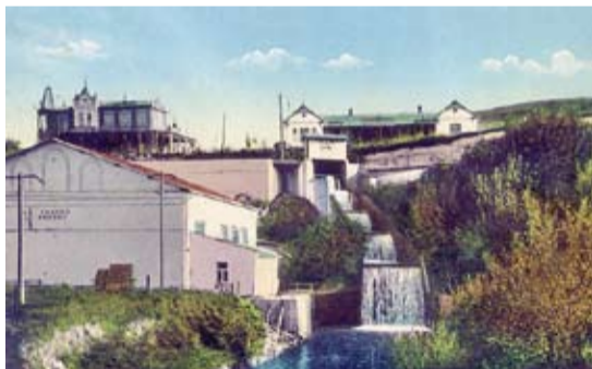
Электростанция «Белый уголь». Фото нач. XX в.

Запущена электростанция «Белый Уголь», а значит, на курорте появилось электрическое освещение.