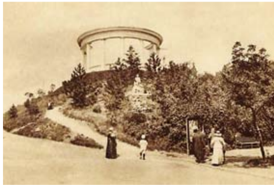
Беседка «Ореанда». Перед ней видна скульптура «Мужичок»

Лечебный парк украсился скульптурами «Орел» и «Мужичок» Л.К. Шодкого, беседкой «Эолова арфа» (до наших дней не сохранилась) и «Ореанда», каменной лестницей с «Капитанским мостиком» и беседкой «Приди ко мне», а также многими другими маленькими шедеврами.