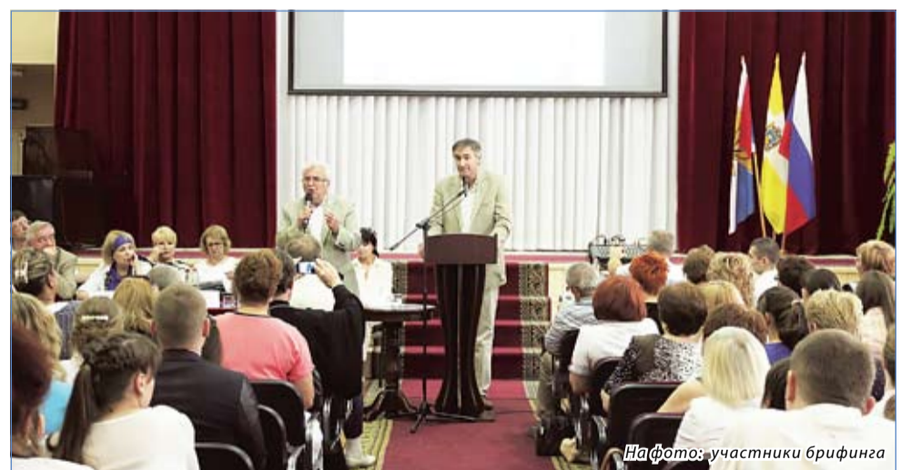
На фото: участники брифинга