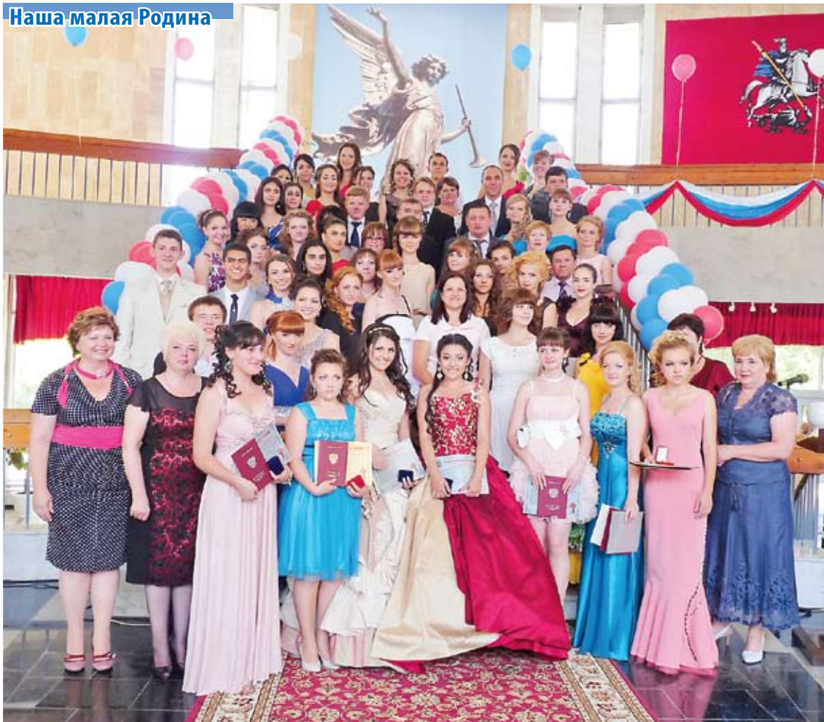
Торжественный прием медалистов главой города в «Пятитысячнике»