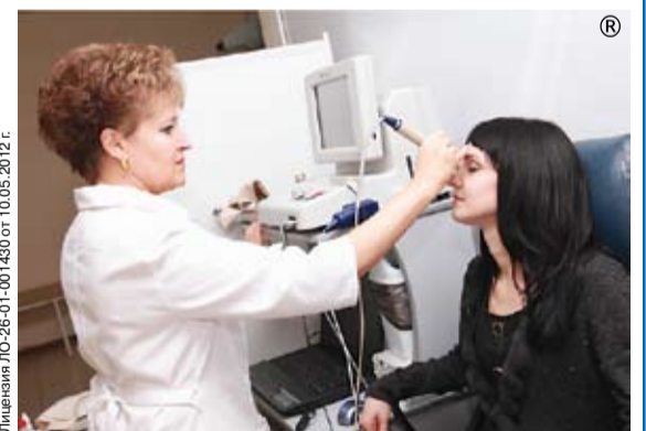
Лицензия ЛО-26-01-001450 от 10.05.2012 г.

ИМЕЮТСЯ ПРОТИВОПОКАЗАНИЯ. НЕОБХОДИМА КОНСУЛЬТАЦИЯ СПЕЦИАЛИСТА