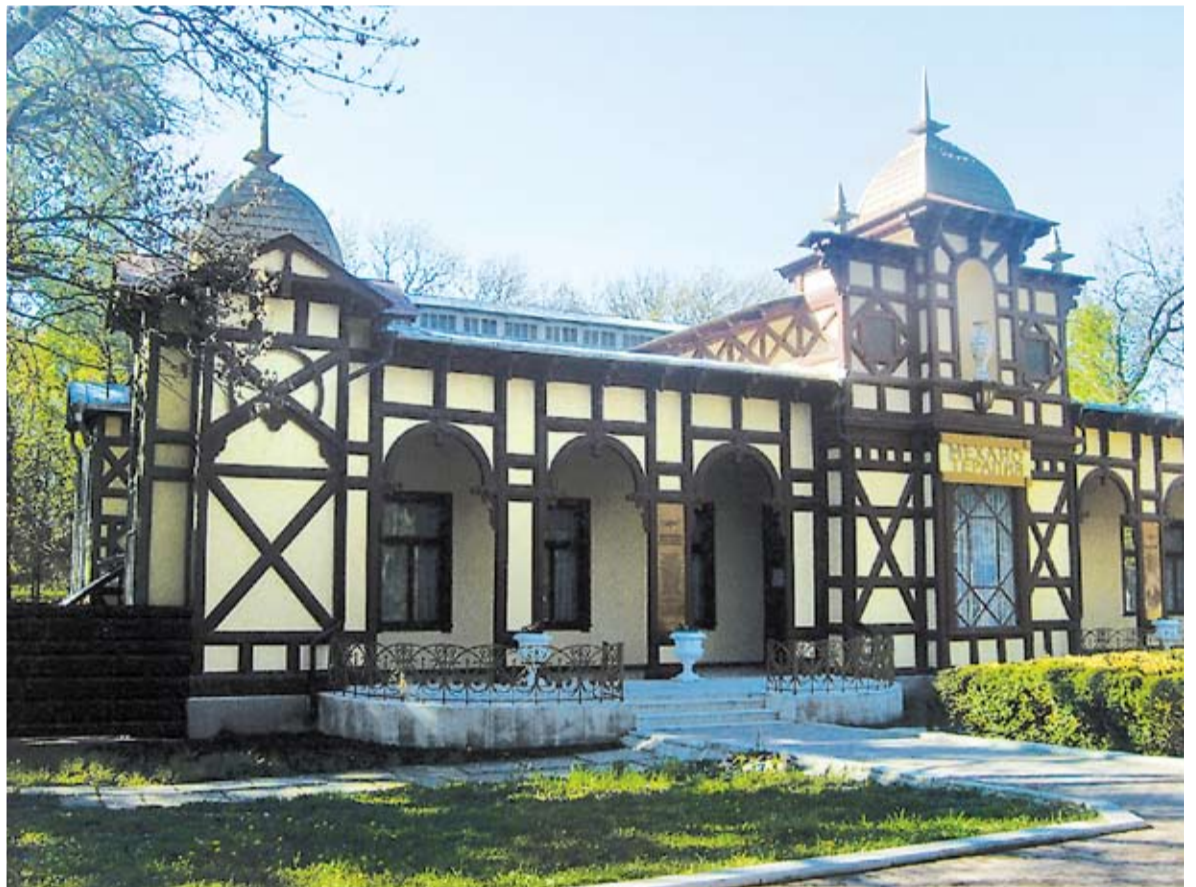
В Курортном парке