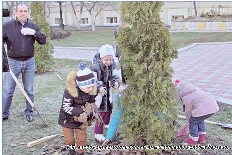
Юные горожане помогли копать ямы и поливали молодые деревца.

Кроме того, Лечебный парк, являющийся сегодня ключевым элементом курортной инфраструктуры, тоже стал собственностью города. И нам предстоит масштабная работа по возвращению Лечебному парку облика, достойного курорта федерального значения.