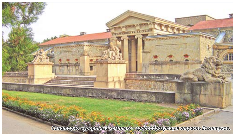
Санаторно-курортный комплекс – градообразующая отрасль Эссентуков.

От деятельности санаторно-курортных учреждений и гостиничных предприятий