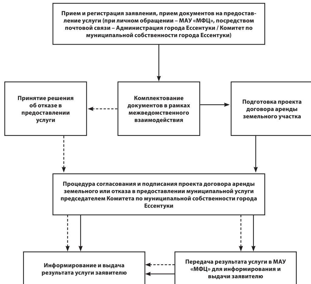
Блок-схема предоставления земельного участка в аренду собственнику объекта незавершенного строительства, расположенного на земельном участке

Приложение 2 к административному регламенту предоставления муниципальной услуги «Предоставление в аренду находящегося в муниципальной собственности земельного участка, на котором расположены объекты незавершенного строительства, однократно для завершения их строительства собственникам объектов незавершенного строительства»