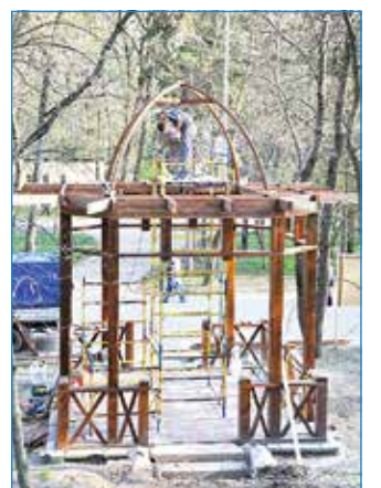
Фото Александра КОВЫЛИНА