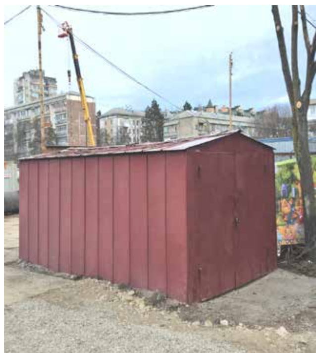
Гараж на ул. Кисловодской, 36а, к. 1