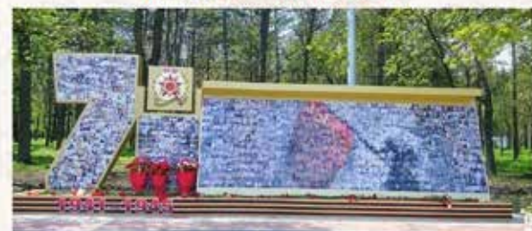
Материалы подготовила Анна БЕЛОУСОВА

Сбор материала ведется отделом рекламы Управления архитектуры и градостроительства администрации города Ессентуки по адресу: г. Ессентуки, ул. Вокзальная, 33а, каб.6, тел. 7-70-93 Эл. почта: adm-essentuki@yandex.ru