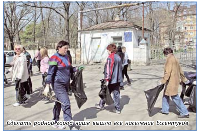
Сделать родной город чище вышло все население Ессентуков

Ессентуки становятся чище и краше. Вместе с природой расцветает и курорт. И в этом немалая заслуга его жителей — тех, кто в минувшую субботу вышел на улицы родного города, чтобы навести порядок. Практически во всех районах сотни ессентучан убрали мусор, листву, белили деревья, облагораживали и благоустроивали придомовые территории. Так Ессентуки откликнулись на общегородской субботник, который впервые в этом году проходил в масштабах всего Ставрополья.