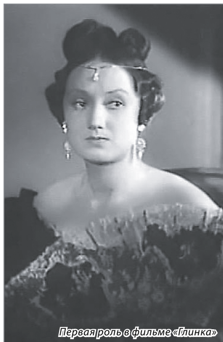
Первая роль в фильме «Глинка»