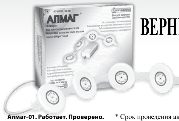
Алмаг-01. Работает. Проверено.

Только при покупке в марте в аптечных сетях