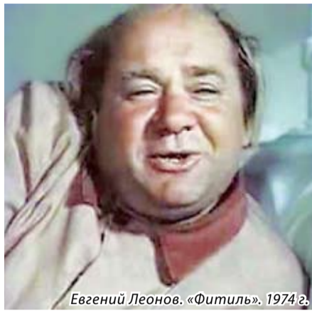
Евгений Леонов. «Фитиль». 1974 г.

Сегодня мы приготовили несколько сюжетов или, как принято говорить в кино, эпизодов. Первый относится к далекому 1962 году, когда на экранах советских кинотеатров был показан первый выпуск сатирико-юмористического киножурнала «Фитиль». Основной его целью являлась критика взяточничества, разгильдяйства, бюрократии, хищения госимущества и пьянства. Там снимались замечательные актёры, лю-