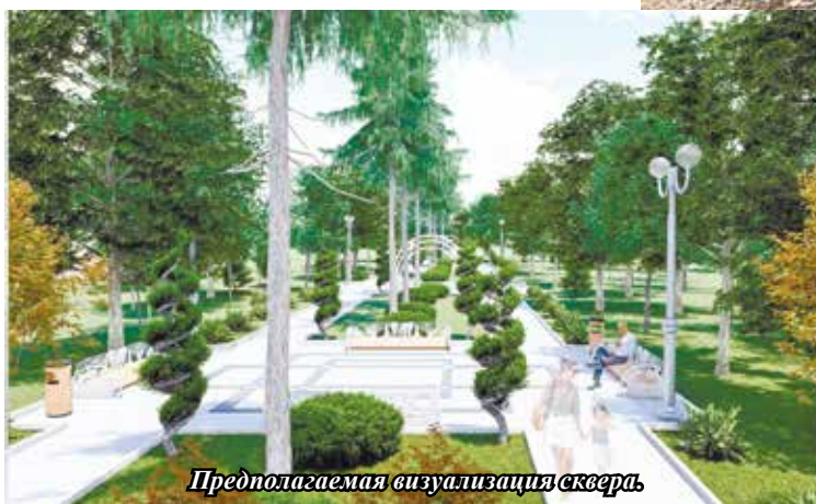
Предполагаемая визуализация сквера

Напомним, что в рейтинговом голосовании, проводимом в 2023 году по выбору объектов благоустройства общественных территорий г. Эссентуки на 2024 год, больше всех голосов собрал победитель – объект «Сквер Самшитовый», набравший больше 13,5 тысячи голосов.