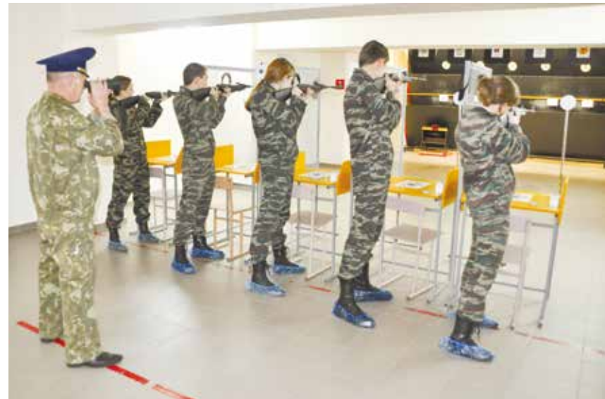
Соб. инф.

Поздравляем все ребят с победой и желаем дальнейших успехов в спорте!