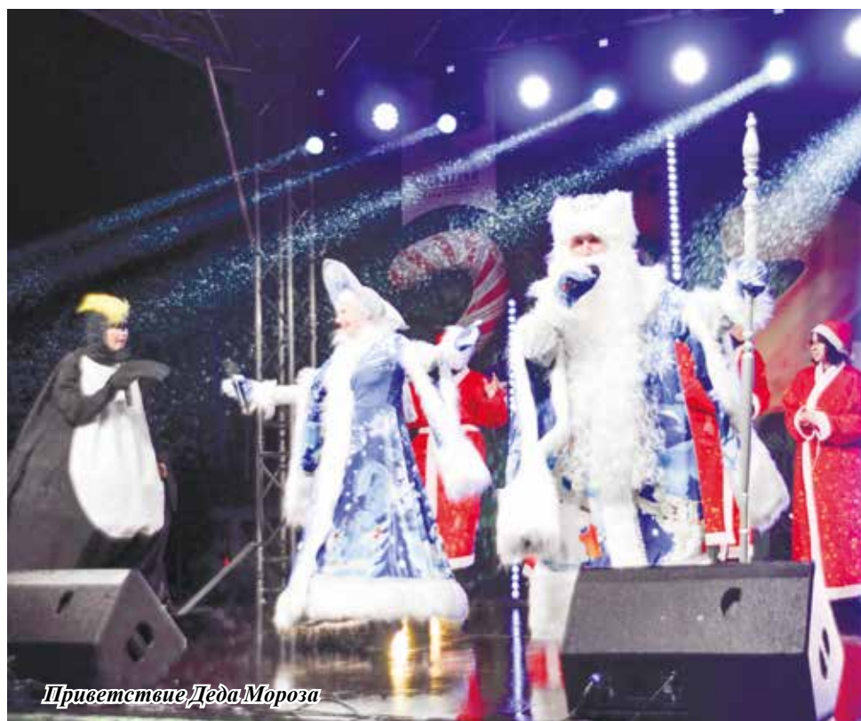
Приветствие Деда Мороза

Дети постарше с упоением рассказывали стихи и получали от дедушки подарки, а совсем крошки тоже были одарены волшебником гостинцами. После встречи – памятное фото. Прийти к Деду Морозу можно еще до 31 декабря ежедневно с 16.00 до 19.00.