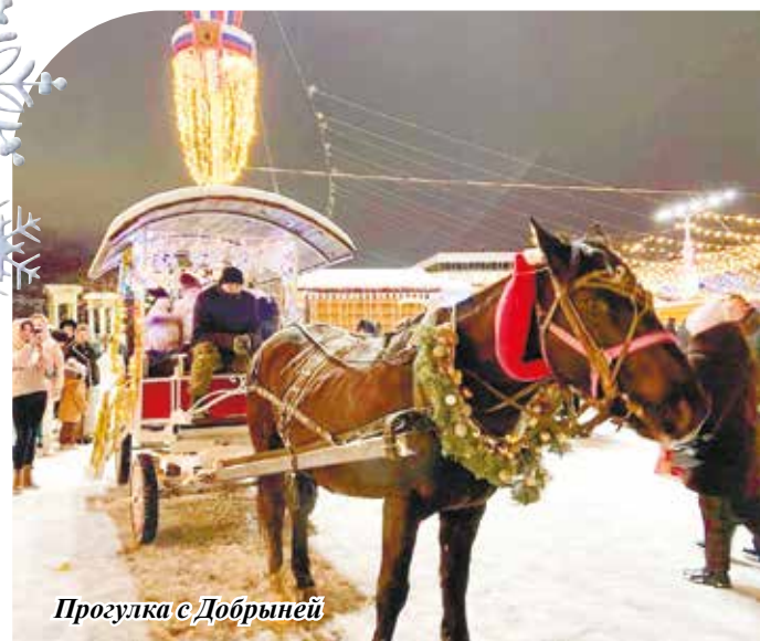
Прогулка с Добрыней