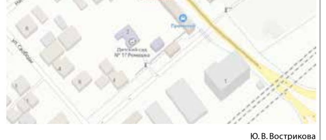
Схема с указанием территории, в отношении которой проводятся публичные слушания