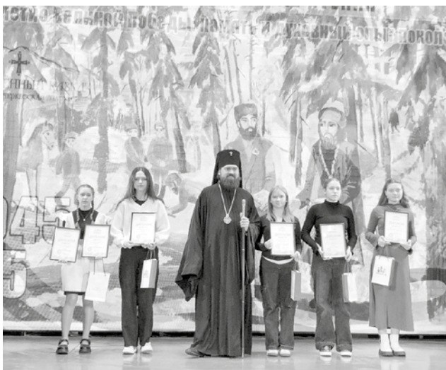
ознакомятся с историей Великой Отечественной войны.

В 2024 году конкурс проводится в юбилейный, 20-й раз, и посвящен 80-летию Великой Победы. По итогам регионального этапа работы победители будут направлены в Москву для участия в заключительном этапе. Его лидеры посетят музеи Москвы и Санкт-Петербурга, где