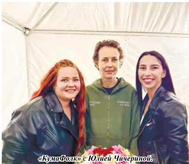
«КумаФолк» с Юлией Чичериной.