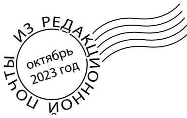
ГРАФИК личных приемов граждан главой города и заместителями главы администрации г. Ессентуки на октябрь 2023 года