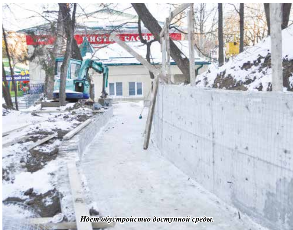
Идет обустройство доступной среды.