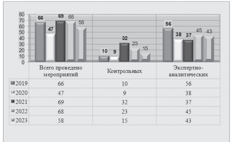
Диаграмма № 2

Количество проведенных контрольных и экспертно-аналитических мероприятий в динамике 2019-2023 годов