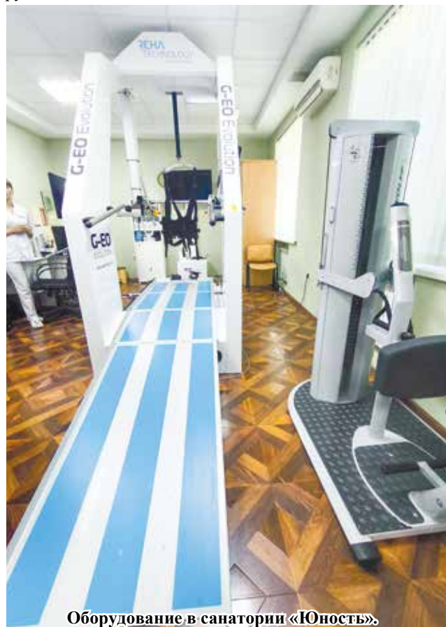
Оборудование в санатории «Юность».

Сенатор осмотрел спальный и лечебный корпуса. Центр на сегодняшний день является единственным в СКФО, где дети и взрослые по ОМС могут пройти реабилитацию на уникальном высокотехнологичном оборудовании.