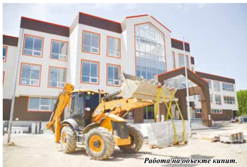
Работа на объекте кипит.

«Строящаяся школа в микрорайоне Северном, мы с коллегами называем её «тысячная», реализуется как будущее учебное заведение нового формата и поколения с продуманным дизайном, комфортными образовательными зонами, спортивной составляющей и для отдыха. Уверен, школа даст широкие возможности для развития юных ессентучан и станет точкой притяжения для жителей микрорайона. Уже сейчас мы продумываем, какие спортивные, культурные и патриотические программы будут осуществляться на территории «тысячки». Город реализует этот проект благодаря поддержке федерального и краевого центров».