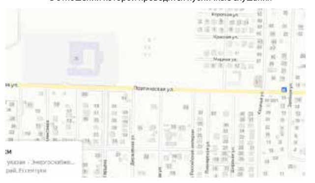
Схема с указанием территории, в отношении которой проводятся публичные слушания