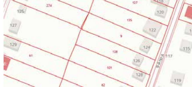
Схема с указанием территории, в отношении которой проводятся публичные слушания

Начальник УАиГ г. Эссентуки Ю. С. Колбазов