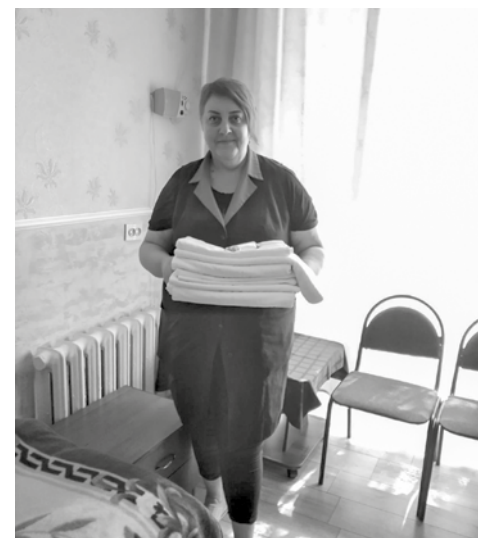
Полосу подготовила Анна БЕЛОУСОВА

За дополнительной информацией обращайтесь по тел. в Эссентуках 8 (7934) 2-01-97, Whats App (989) 996-97-00.