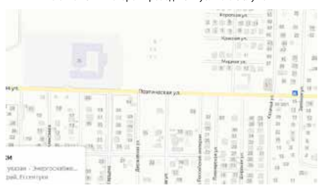
Схема с указанием территории, в отношении которой проводятся публичные слушания