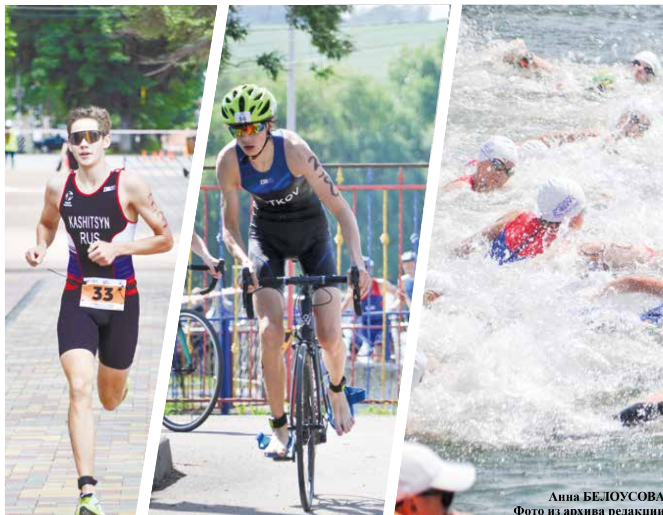
Анна БЕЛОУСОВА