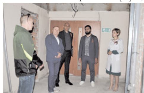
В поликлинике – готовность 18%.