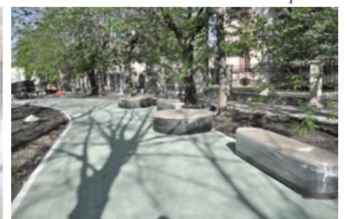
Прогулочная аллея на ул. Анджиевского.