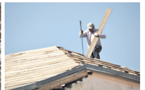
Идет демонтаж кровли.