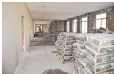
В школе № 4 – работы по графику.

Материалы Валерии ПЕТРОВОЙ